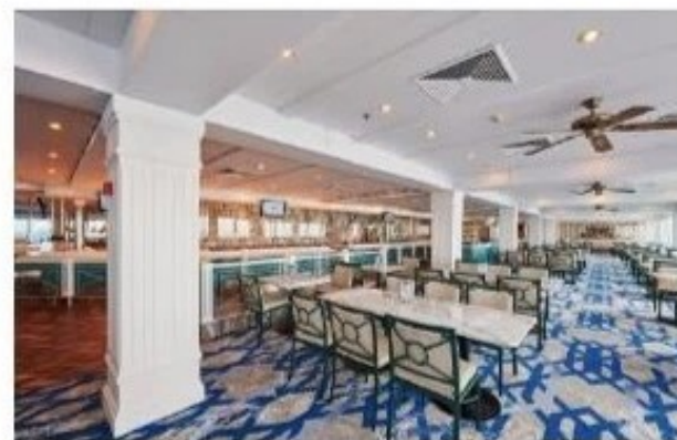
麗都自助及燒烤餐廳